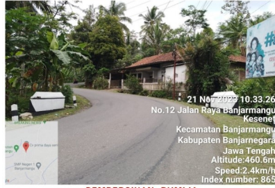
PEMBERSIHAN RUMIJA RUAS BANJARNEGARA - WANAYASA KM. 56+600 SELASA, 21 NOVEMBER 2023