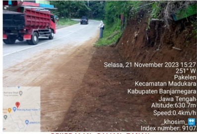
PEKERJAAN GALIAN TANAH RUAS BANJARNEGARA - WANAYASA KM. 61+080 SELASA, 21 NOVEMBER 2023