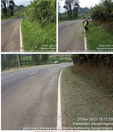
PEMBERSIHAN RUMIJA RUAS WANAYASA - KALIBENING KM. 86+200 SENIN, 20 NOVEMBER 2023